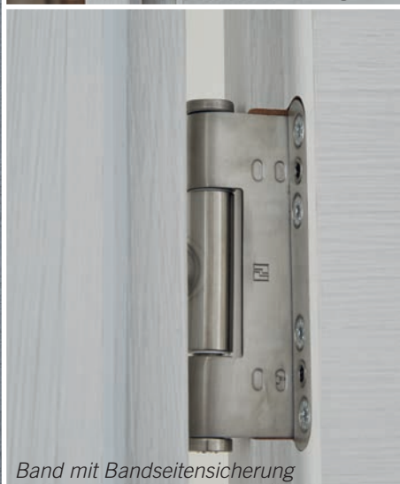
Band mit Bandseitensicherung